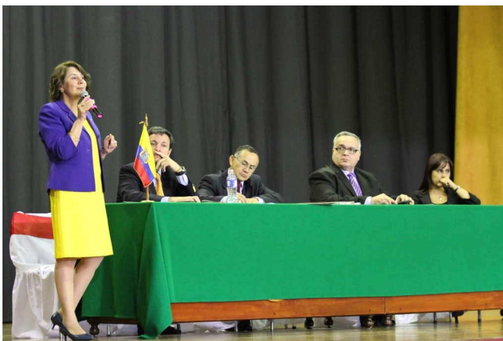
Panel No. 3